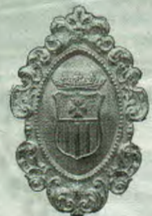
Escudo de la Orden Mercedaria.

Escudo de la Merced. Se quitarán los colores al ser pintura al aceite.